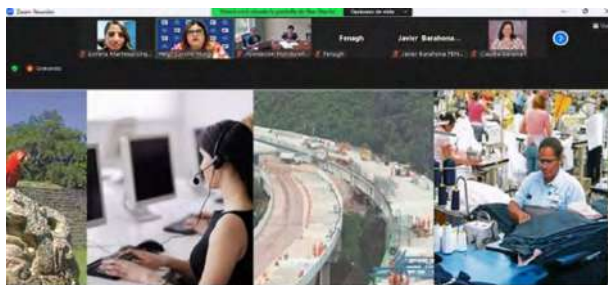
GERENCIA DE POLÍTICA COMERCIAL Tratado de Libre Comercio Honduras – República Popular de China

En el mes de febrero, equipo de la Gerencia de Política Comercial participó en reuniones de comités nacionales para continuar con las discusiones de los Reglamentos Técnicos Centroamericanos vinculados con el área de medicamentos y alimentos: